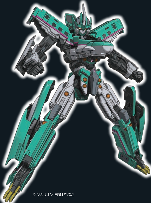
シンカリオン E5はやぶさ