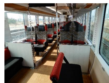
地図および画像はすべてイメージです。

「リゾートあすなろ」は2010年12月の東北新幹線新青森開業に合わせ、津軽線・大湊線を運行するリゾート列車として登場しました。車内は広々とした客室や、運転台の後部にある展望室など、車窓を楽しむための工夫が盛りだくさん。環境への負荷を低減する「ハイブリッドシステム」を搭載した車両です。