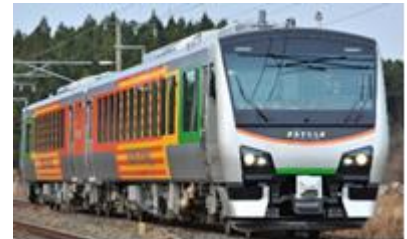
HB-E300 系 (イメージ)

釜石(12:30 発) ▶ 遠野(13:42 着/13:55 発) ▶ 花巻(14:49 着) ※上有住に停車します。