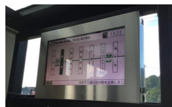
BRTロケーションシステム