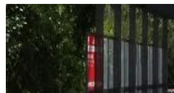
地ノ森駅・田茂山駅