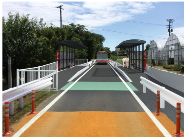
岩月駅イメージ(松岩駅方面から最知駅方面へ)