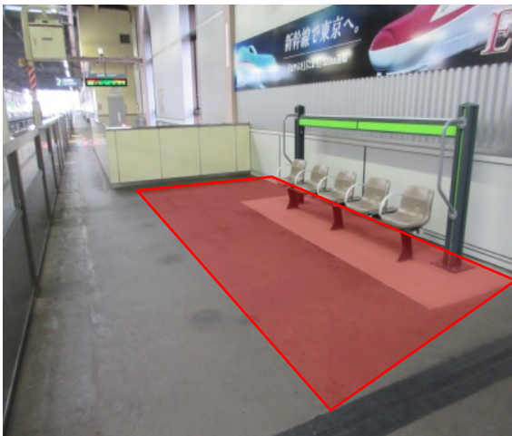
【待合室新設箇所（ホーム）】