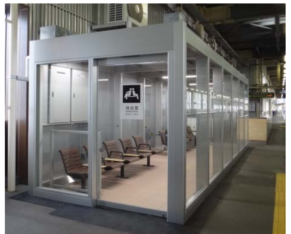
【新設イメージ（写真は新花巻駅待合室です）】