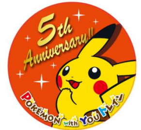
【限定ヘッドマーク】

期間中、特別デザインのヘッドマークで運行し、5周年をお祝いいたします。5周年期間限定のヘッドマークを取り付けた列車での旅をぜひお楽しみください！