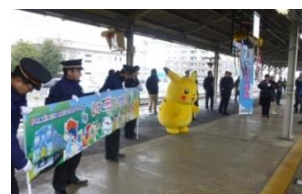
【ピカチュウによるお見送り】

5周年を記念し、ピカチュウが一ノ関駅・気仙沼駅に登場！！ みなさまと一緒に列車のお見送りとお出迎えを行います！