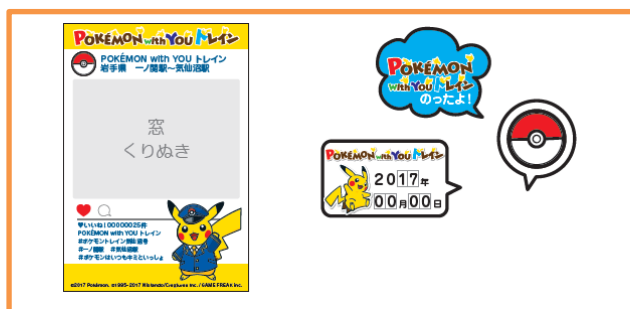
【フォトパネルイメージ】

車内でのひとときをより楽しんでいただくため、新しいコンテンツとして、車内で写真撮影に使用していただけるフォトパネルをご用意いたします。