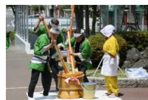
【祝い餅のお振舞い】