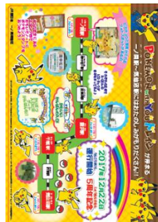
【クリアファイル（裏）】