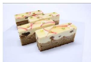
【Hメトロポリタン盛岡 NEW WING】 ボンム・ラムレザン

○協賛店 【盛岡駅ナカ店】 ぐるっと遊盛岡駅店、美味山海盛岡駅店、大地館、もりおか銘品館 【フェザン】 ビア&ヴルスト ベアレン、リカーコート プロースト、 純情産地いわての店「みのるダイニング」、食彩工房、 かわとくキューブミニ、北星館、回進堂、御菓子司 山善、 フルールきくや、岩手の地酒KIKIZAKEYA、三陸菓匠さいとう、 岩手菓子俱、楽部、東北めぐり いろいろ、TOMATOMAとつか