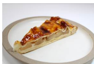
【銀河堂 1890 Sweets & Bakery】 アップルパイ