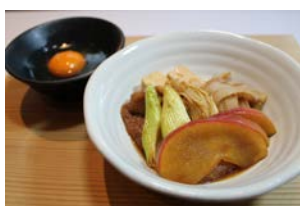
【駅の串揚げ家】 りんご好き

○メニュー提供 【盛岡駅ナカ店】 駅の串揚げ家、南部いろり庵盛岡駅店、iwate tetoteto 【フェザン】 回転鮎 清次郎、フレスキッシー、ビア&ヴルスト ベアレン、 アーロンコーヒー&ビアスタンド、銀河堂 1890 Sweets & Bakery 【Hメトロポリタン盛岡 NEW WING】 ティーラウンジ クローバー