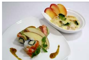
【回転鮎 清次郎】 アップルロール/りんごグラタン