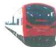
「きらきらみちのく下北」イメージ

接続 【往路】 八戸駅：東京・仙台方面「はやて 3号(10:39着)」から接続。 野辺地駅：青森方面「つがる 16号(12:08着)」から接続。 【復路】 野辺地駅：青森・函館方面「スーパー 白鳥19号(16:46発)」に接続。 八戸駅：仙台・東京方面「はやて 28号(18:00発)」に接続。