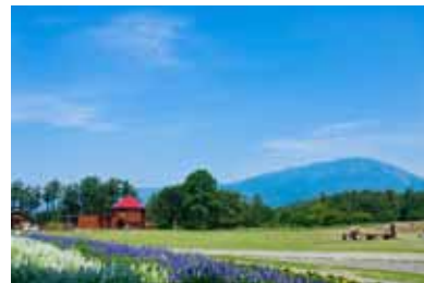
雫石町・小岩井農場 (イメージ)

第二のふるさとに出会う旅をしてみたい！ 田舎の日常生活を体験したい！ 地域の皆さんと交流したい！ そんな方は是非、ご参加ください！