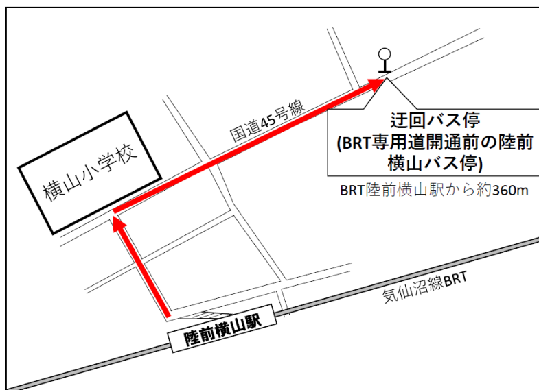
陸前横山駅 迂回バス停位置図