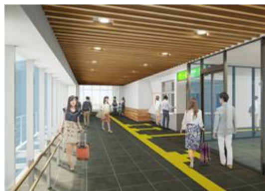
【東西自由通路内観】