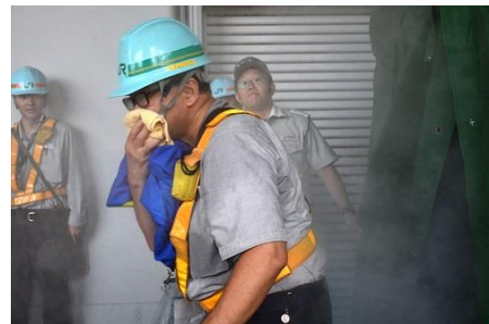
【消防との連携、列車からのお客さま救助・避難誘導訓練（一ノ関地区訓練イメージ）】