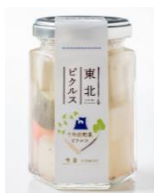
【十和田野菜ピクルス】

青森県産りんご「ふじ」をけんぴ形状にカットしノンフライ・無添加・調味なしの新しい食感の林檎けんぴをデザートbuffetで提供いたします。