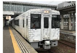
【TOHOKU EMOTION AOMORI (イメージ)】