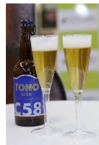
【TONO BEER GOLDEN ALE】