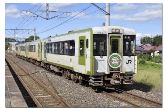
【限定ヘッドマーク】