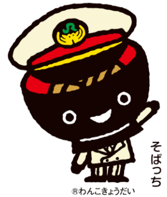
【@わんこきょうだいそばっち】