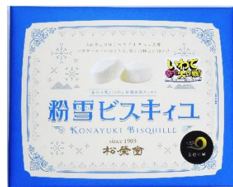
【パッケージ（イメージ）】