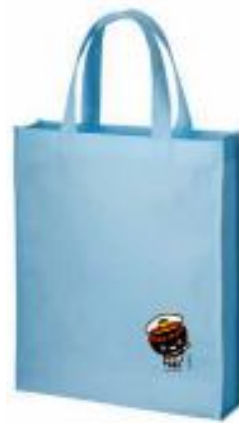
【オリジナルエコバッグ】