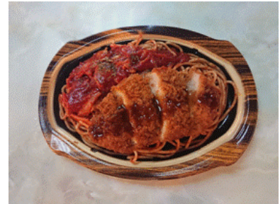
【ナポリかつ（イメージ）】