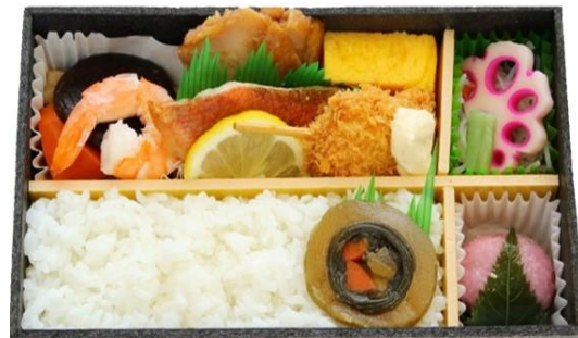
【駅弁内容（イメージ）】