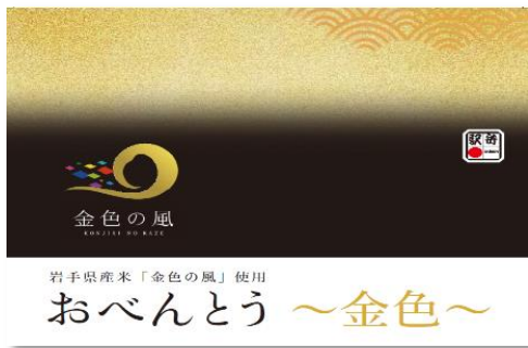
【パッケージ（イメージ）】