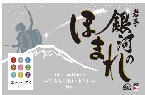
【パッケージ（イメージ）】