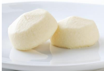
【粉雪ビスキュユ（イメージ）】