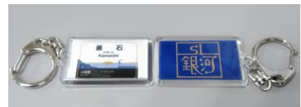
SL銀河駅名標キーホルダー