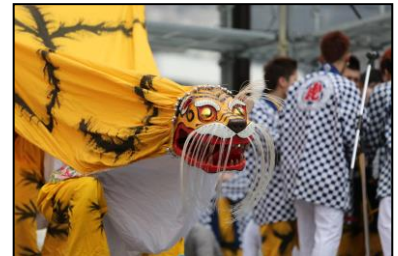
郷土芸能「釜石虎舞」