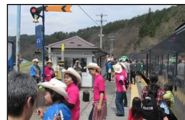
宮守駅「カントリーダンス」