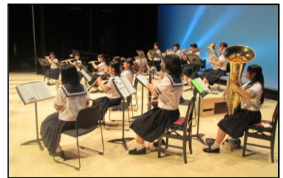
釜石高校「吹奏楽部演奏」