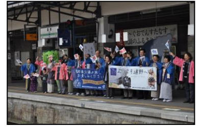
遠野駅お出迎え・お見送り