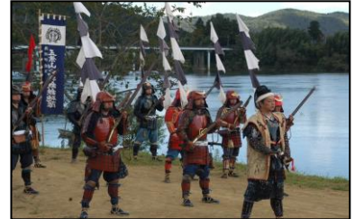
ごようざんひなわじゅうてっぽうたい 「五葉山火縄銃鉄砲隊」