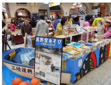
岩手県観光コーナー