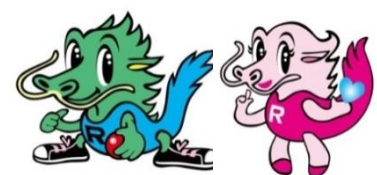
【岩泉龍泉洞PRキャラクター】 「龍ちゃん」 「泉ちゃん」