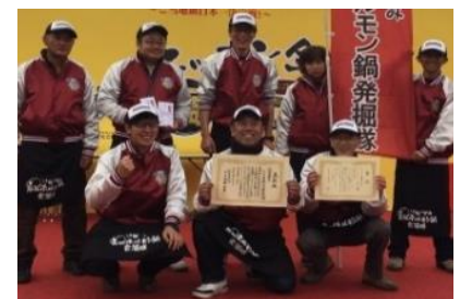
【いわいずみ炭鉱ホルモン鍋発掘隊】