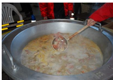
【毛ガニ大鍋お振舞い】