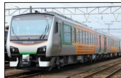
快速「さんりくトレイン宮古」 (往路: 盛岡→宮古利用)