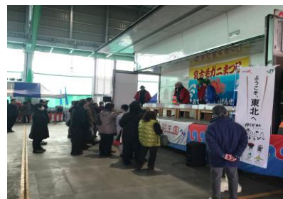
【毛ガニ体験セリ市】