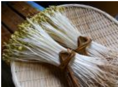
・大鰐温泉もやし 鰐 come【大鰐町】