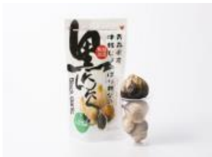
・青森県産 じよっぱり親父の黒にんにく (有)ケイエス青果【田舎館村】