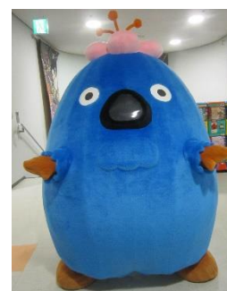
あおもり観光 マスコットキャラクター 【いくべえ】®