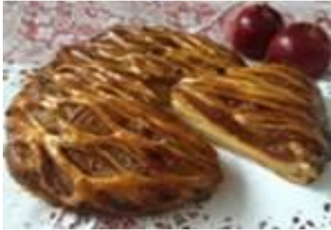
・王道アップルパイ コマモ・ファミリー(株)【弘前市】