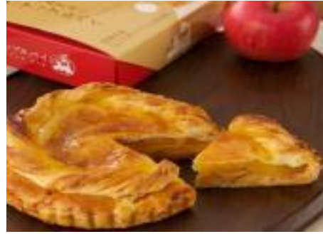
・青森窯出しアップルパイ (株)富士清ほりうち【青森市】