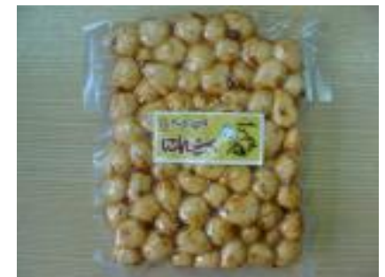
・かつお風味にんにく 中清食品工業(株)【藤崎町】