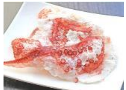
・たこロール (株)中村漁業部【八戸市】