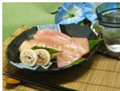
・いかずし デリカむつ【むつ市】