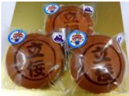
・立佞武多りんごどら焼 (株)JIN CARE【五所川原市】