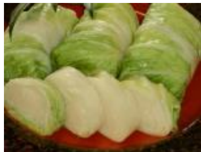
・葉くるみ漬 熊谷食品(株)【弘前市】