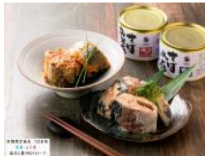
・平成三十年秋鯖限定商品 さば缶(水煮・みそ煮) (有)みなみや【むつ市】