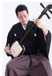
(有)三音音楽事務所 津軽三味線 生演奏