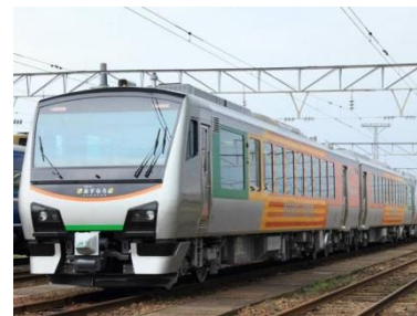
快速「さんりく宮古号」