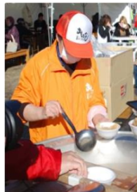
【元祖・宮古鮭まつり】