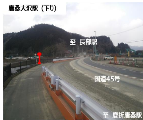
唐桑大沢駅イメージ