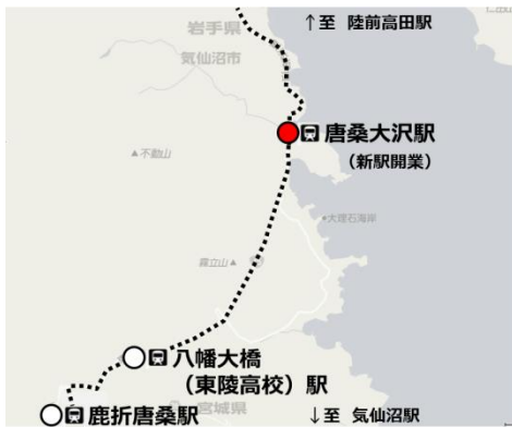
大船渡線BRT 唐桑大沢駅