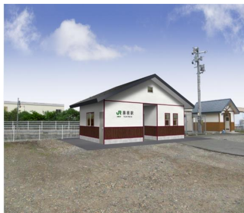
【外観完成イメージ】