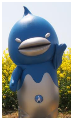
※ λ (ラムダ) プロジェクト シンボルキャラクター「マギュロウ」