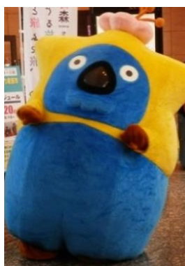
青森県・函館観光 マスコットキャラクター 「いくべえ」®