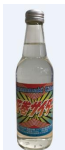
【花巻サイダー(イメージ)】