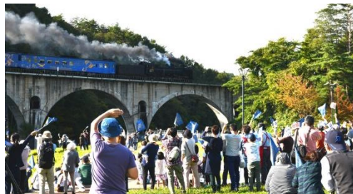
【「めがね橋」を渡る SL 銀河】