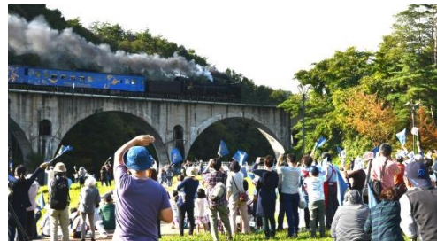
【「めがね橋」を渡る SL 銀河】