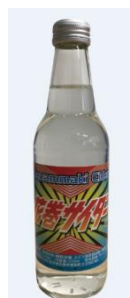
【花巻サイダー(イメージ)】