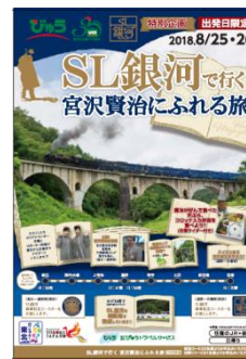
【パンフレット(イメージ)】