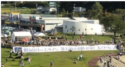
【昨年の「道の駅みやもり」の様子】

SL 団体専用列車の運行時に、宮沢賢治の作品「銀河鉄道の夜」をイメージさせる“めがね橋”に隣接する「道の駅みやもり」において、地元の方々とともに横断幕と手旗を使って歓迎します。