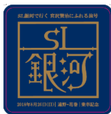
【遠野～花巻間限定コースター】