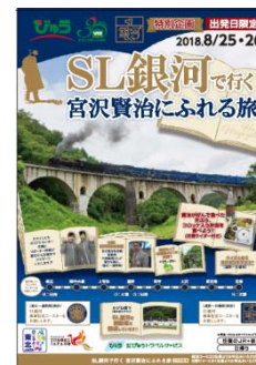
【パンフレット(イメージ)】