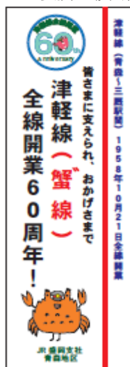
【のぼり旗 イメージ】