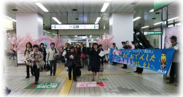
【2017年のお出迎えの様子】