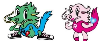
【岩泉龍泉洞PRキャラクター】 「龍ちゃん」 「泉ちゃん」