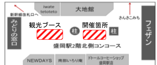
会場位置図 (イメージ)