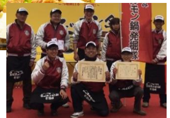
【いわずみ炭鉱ホルモン鍋発掘隊】