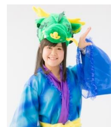
【スペシャルゲスト】 岩手まるごと おもてなし隊 「ミラクル龍子ちゃん」