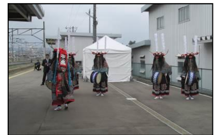
花巻駅「 ししおどり 鹿踊」