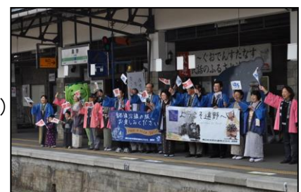
遠野駅お出迎えの様子