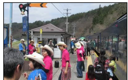
宮守駅「カントリーダンス」