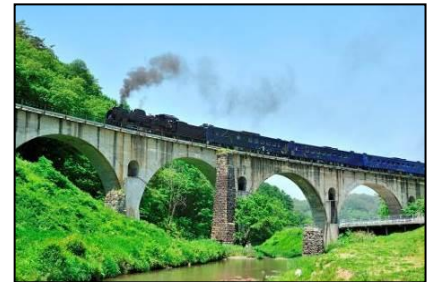
SL 銀河走行イメージ