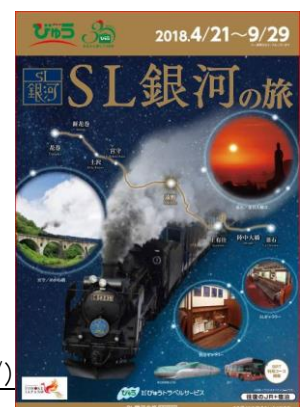
パンフレットイメージ

※詳細はパンフレットやJR東日本盛岡支社ホームページ（ http://www.jr-morioka.com/ ） でご確認下さい。