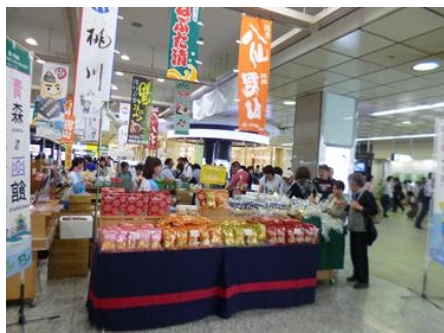
特産品販売イメージ