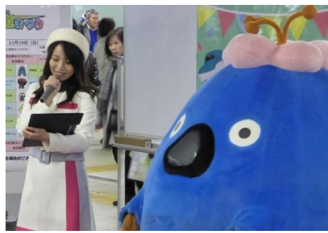
あおもり紀行キャンペーンスタッフによる観光PR、クイズ大会