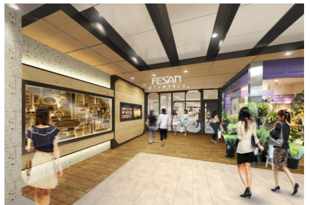
【リニューアルイメージ図】