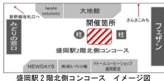
盛岡駅2階北側コンコース イメージ図