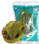
「青天の フィナンシェ抹茶」