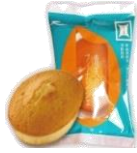
「青天の フィナンシェ」