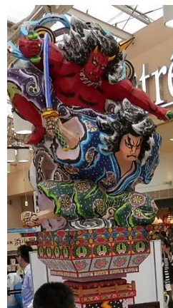
五所川原市の立佞武多 (3.1m程のミニサイズ)