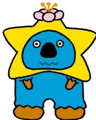
青森県・函館観光 マスコットキャラクター 「いくべえ」®