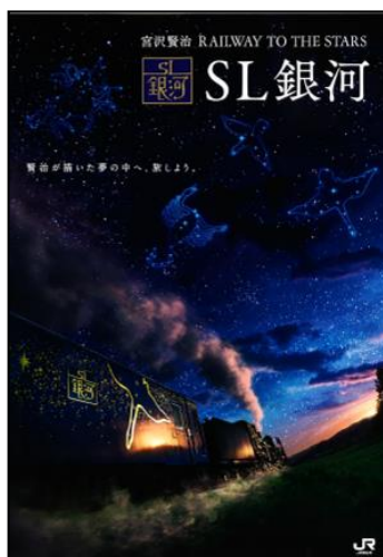
【パンフレット表紙イメージ】

2017 年度「SL 銀河」パンフレットは、釜石線沿線活性化委員会のご協力により、釜石線沿線の観光情報が加わった内容となっております。「SL 銀河」の情報だけでなく、花巻市・遠野市・住田町・釜石市の観光情報やイベントガイドなどの情報もご覧いただくことができます。