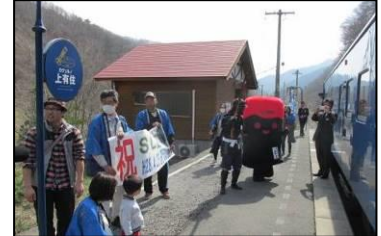
上有住駅お出迎え