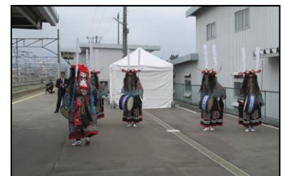
花巻駅「 ししおどり 鹿踊」