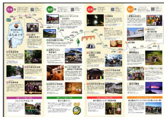
【観光情報ページイメージ】