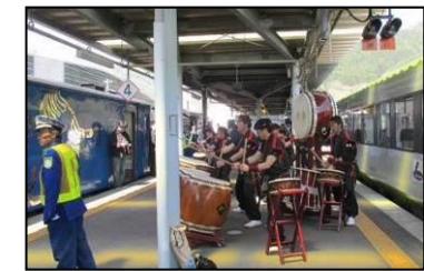
釜石駅「 おうぶだいき 桜舞太鼓」