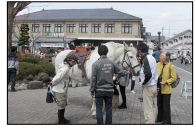
遠野駅前 馬との記念撮影