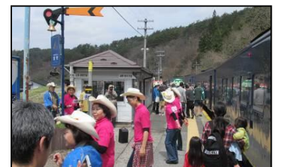
宮守駅「カントリーダンス」