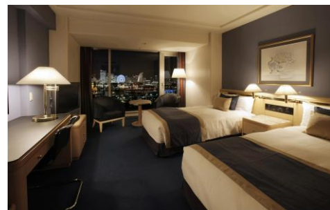
【神奈川・みなとみらい】ホテルニューグランド タワー館高層階ツイン