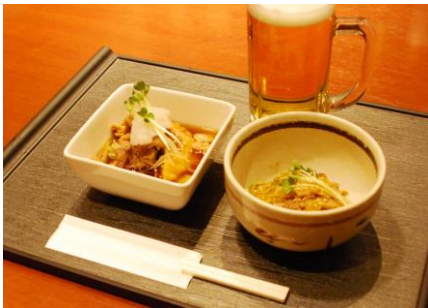
【南部いろいろ庵盛岡駅店】

プレミアムフライデー晩酌セット 1,200円(税込) 白金豚を使用したおつまみ2品と生ビールまたは 500円以下の日本酒のセット 開催日 2月24日～26日 16:00～19:30