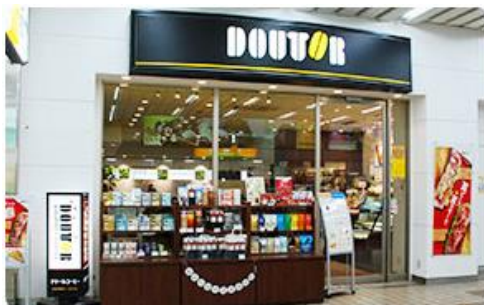
【ドトールコーヒーショップ盛岡駅店】

通常16時を「15時」から営業開始！（2月24日限定） 「南部一郎かぼちゃのサルサソース」 発売開始！450円(税込)