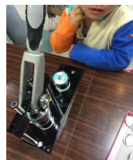
缶バッジ製作体験