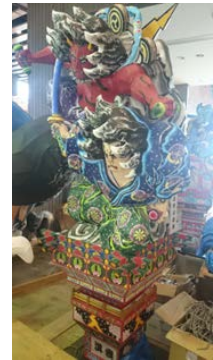
五所川原市の立佞武多 (3.1m程のミニサイズ)