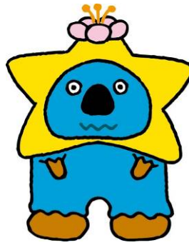
青森県・函館デスティネーションキャンペーン マスコットキャラクター 「いくべえ」®