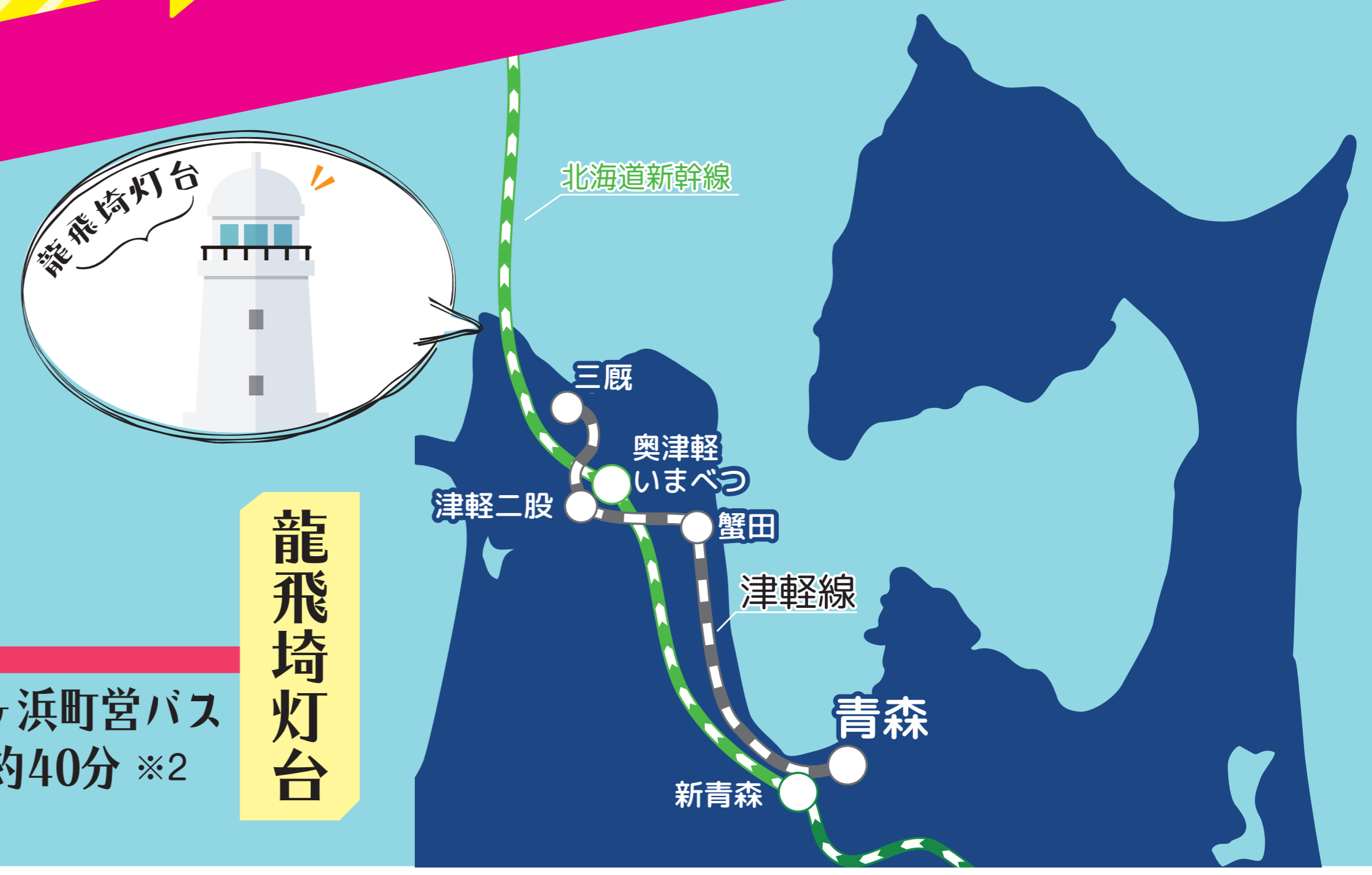
※写真・イラストはすべてイメージです。