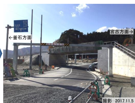
第三釜石街道架道橋改築工事を進めています。