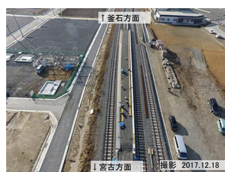
鶉住居駅復旧工事を進めています。