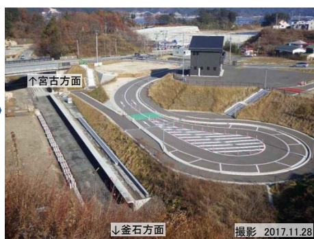
織笠駅(移設後)の整備を進めています。