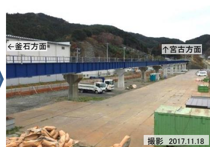
大槌川橋りょうの復旧工事を進めています。