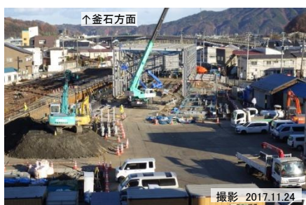
宮古駅構内の設備構築を進めています。