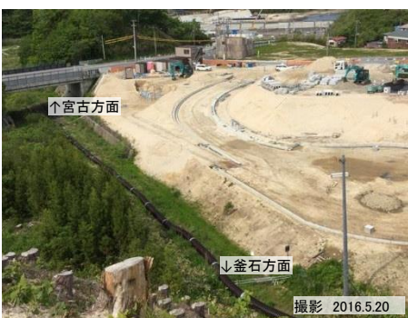
織笠駅(移設後)付近