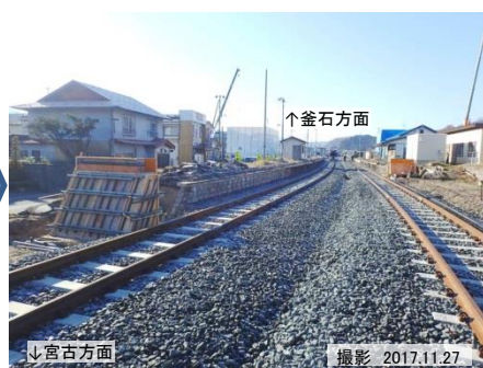
津軽石駅復旧工事を進めています。